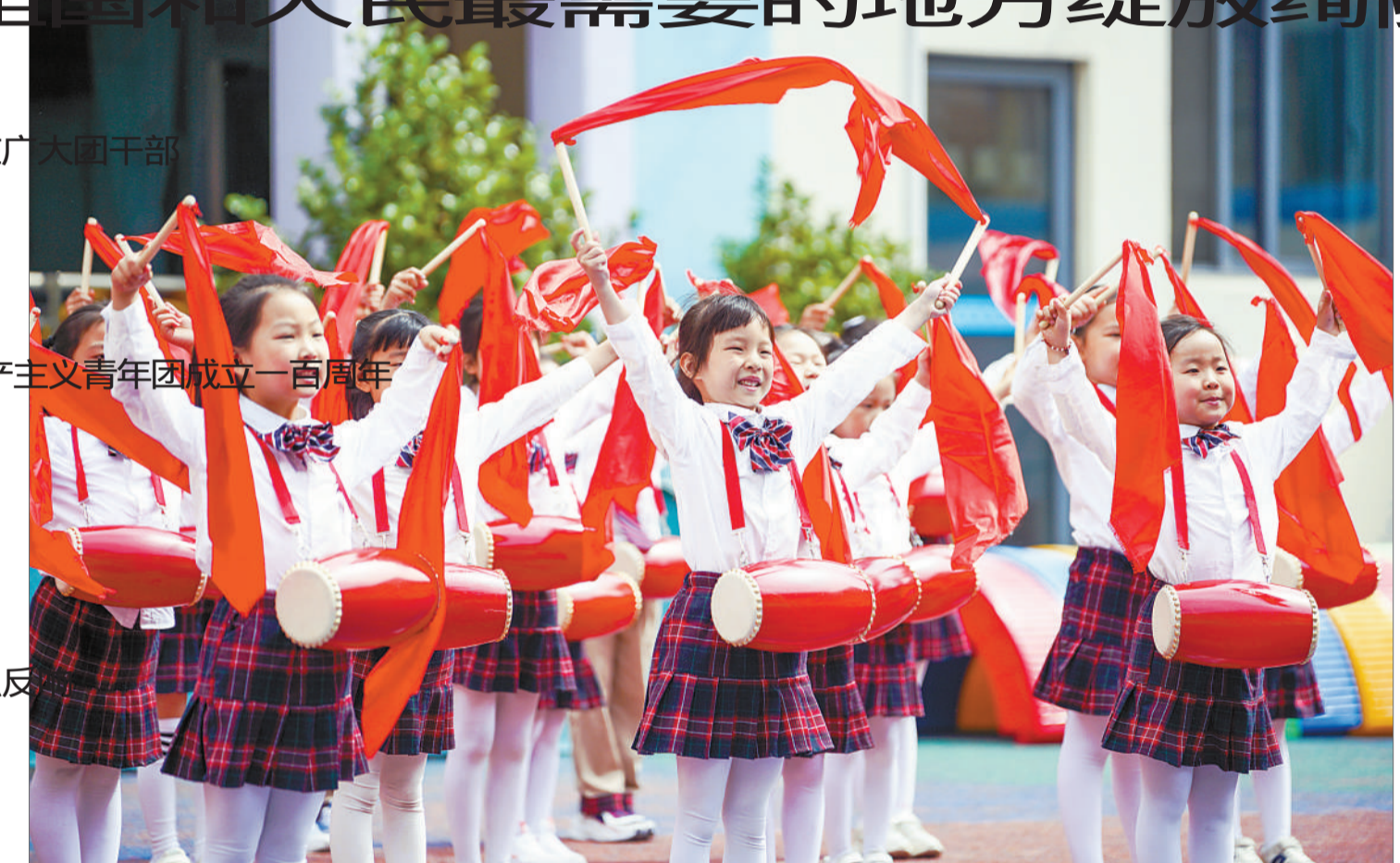
5月19日,浙江省湖州市长兴县,幼儿园的孩子们在练习腰鼓课间操,感受传统民间文化的独特魅力。

你们在信中表示,生逢伟大时代是人生之幸,留学归国青年要心系国家事、肩扛国家责,这些话讲得很好。希望同志们大力