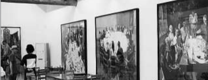
北京市昌平区兴寿镇下苑村侃谱空间(亦为餐厅)。