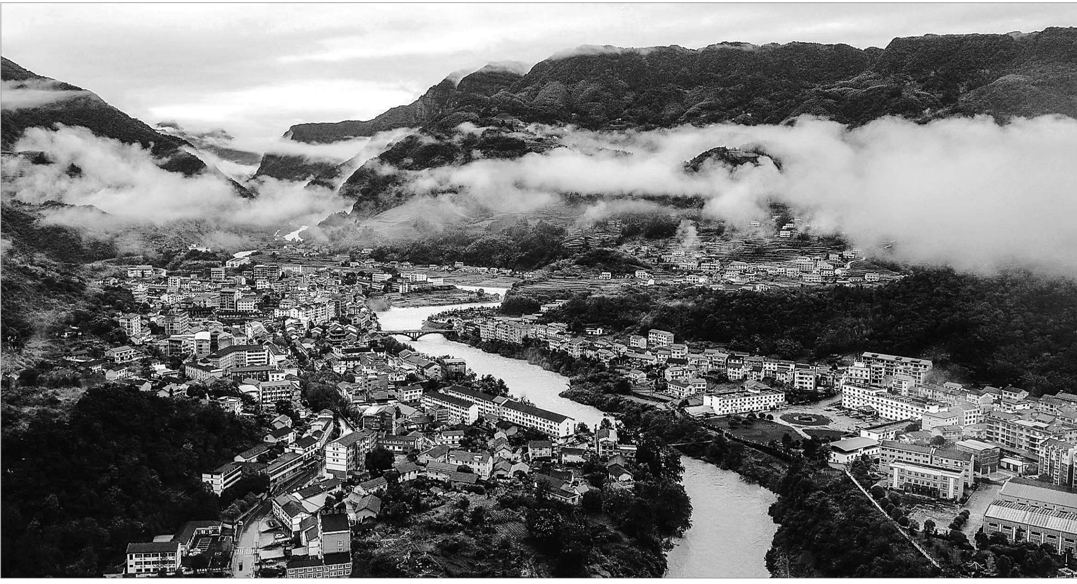
俯瞰湖南省常德市石门县壶瓶山文旅小镇。