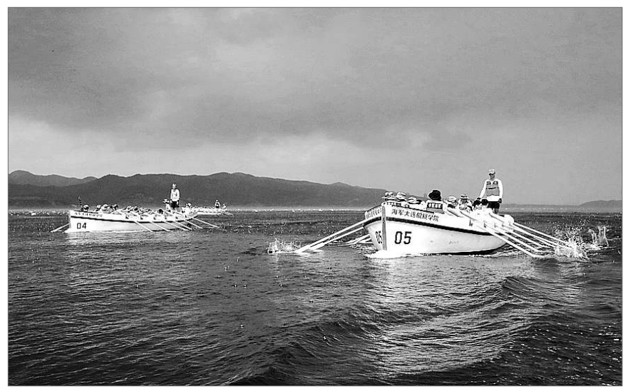
2021年8月,大连舰艇学院举行“海峡勇士-2021”舰艇远航训练,舰艇队海上遭遇雷雨,水手在舵手指挥下奋力荡桨。

近年来,海军大连舰艇学院不断突出为战育人的办学特色,将课堂与战场紧密连接,培养能打仗、打胜仗的未来海战场生力军。学院坚持以战领教,在三尺讲坛上树立起牢固的战斗力标准。