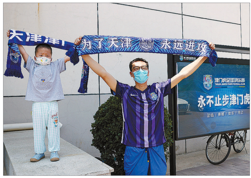
5月22日，天津球迷送津门虎出发前往梅州赛区参加新赛季中超联赛。