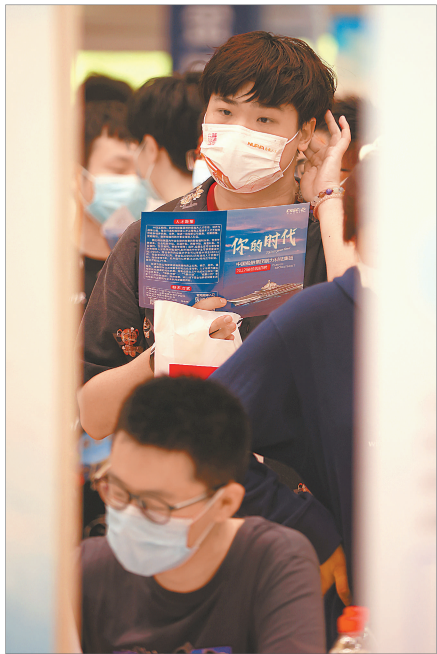
5月29日，江苏南京，大学生在招聘企业展台前驻足。当日，南京航空航天大学举办就业交流暨2022届毕业生百日冲刺专场招聘会。