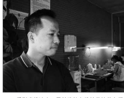
受到疫情冲击，罗益确勉力维持着扶贫车间。