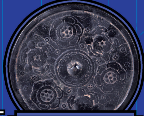
唐宝相花铜镜 (平顶山博物馆藏)

《琴棋书画 铜镜里的生活雅趣》数字藏品之三。铜镜为圆形，半球形钮，十二地支钮座。博局纹镜，也称规矩镜，因酷似盛行于汉代博戏棋局上的纹饰而得名。一面铜镜，承载着古人对天地万物、时空岁月的认知，诉说着先人朴素的宇宙观。看着这面铜镜，仿佛看到了今天人类 可上九天揽月，可下五洋捉鳖 这些探索世界壮举最初的萌芽。