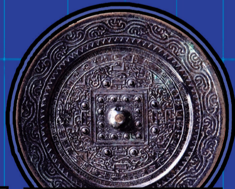
仿汉四神博局铜镜 (潍坊市博物馆藏)

《琴棋书画 铜镜里的生活雅趣》数字藏品之二。铜镜为八出葵花形，圆钮。钮上方饰祥云托月纹，云下田格中有 真子飞霜 四字。这些流传已久、家喻户晓的传说，刻画在铜镜上，其表达的主题是求佳偶、求知音。电荷、鸾鸟、远山，含愁更奏绿绮琴，欣欣向荣、宁静和谐，展现着一幅唐代的世俗生活画卷。