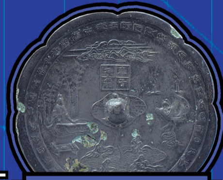
唐真子飞霜铜镜 (青岛市博物馆藏)

《琴棋书画 铜镜里的生活雅趣》数字藏品之一。多贺中国人民富 五乳神兽镜 国家一级文物，以神兽纹为主题。这是汉代铜镜较常见的装饰题材。铜镜主题纹饰外圈所铸铭文出现了 多贺中国人民富、中国人民 一词。在汉代铜镜铭文中出现，十分难得，这一段铭文，寄托着汉代人民对国家的祝福，表达了人民渴望国泰民安、风调雨顺、五谷丰登的心愿。