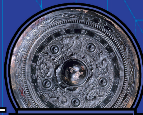
汉 多贺中国人民富 五乳神兽镜 (武汉博物馆藏)

《琴棋书画 铜镜里的生活雅趣》数字藏品之一。多贺中国人民富 五乳神兽镜 国家一级文物，以神兽纹为主题。这是汉代铜镜较常见的装饰题材。铜镜主题纹饰外圈所铸铭文出现了 多贺中国人民富、中国人民 一词。在汉代铜镜铭文中出现，十分难得，这一段铭文，寄托着汉代人民对国家的祝福，表达了人民渴望国泰民安、风调雨顺、五谷丰登的心愿。