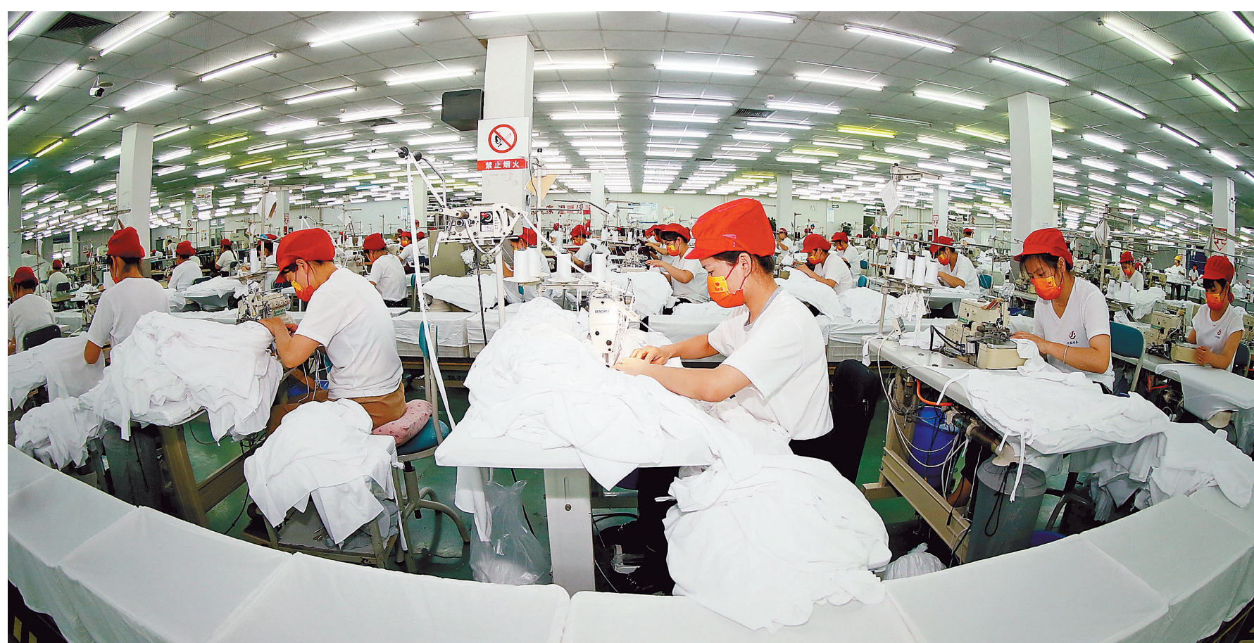
5月26日，安徽省阜阳市太和县，一家服装企业工人生产出口到海外的服装。今年以来，当地政府加大纾困力度，落实减税降费、资金扶持等各项政策。