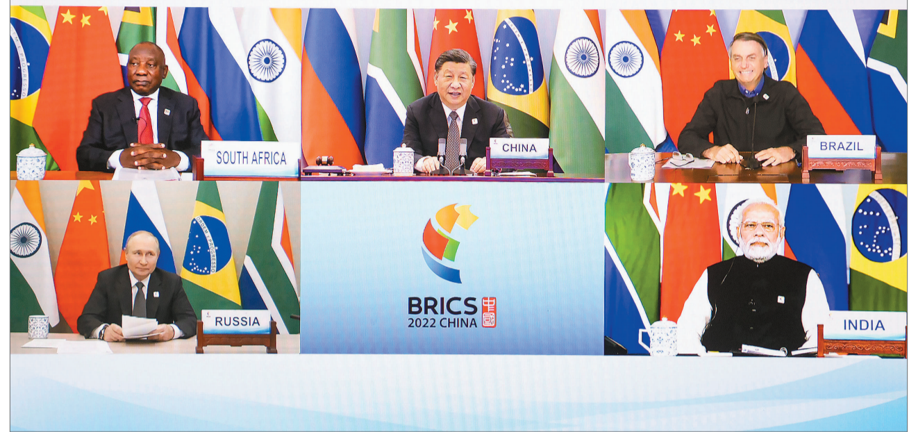
6月23日晚,国家主席习近平在北京以视频方式主持金砖国家领导人第十四次会晤并发表题为《构建高质量伙伴关系 开启金砖合作新征程》的重要讲话。南非总统拉马福萨、巴西总统博索纳罗、俄罗斯总统普京、印度总理莫迪出席。