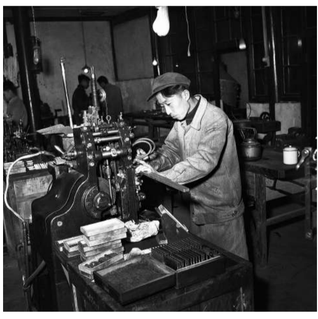
1956年4月,在仓夹道铸字车间,一名工人正在工作。