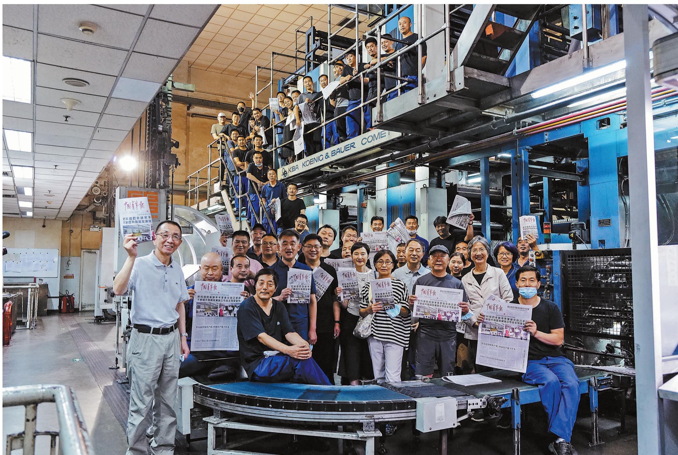
6月30日凌晨,北京,中国青年报社印刷厂,报纸印刷结束后,中青报新老报人拿着当天的《中国青年报》在印刷车间合影留念。当天是一个特殊的出报日,自7月1日起,中国青年报社印刷厂将不再承接印报业务。许多记者、编辑和已经退休的老报人都聚在印刷车间,见证这难忘的一夜。