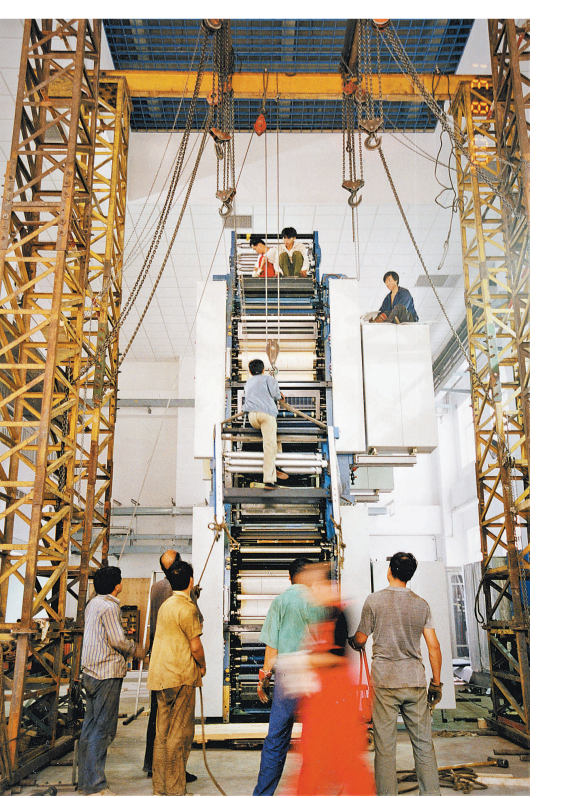
2000年8月3日,北京,中国青年报社印刷厂内,工人们正在安装全自动高速多色印报生产线的第一个印刷单元。