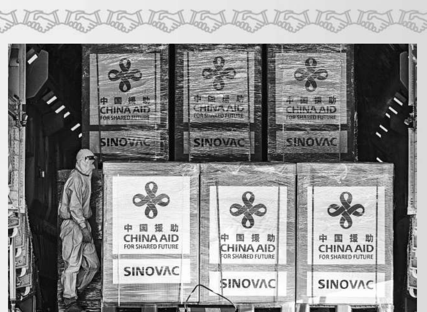
2021年2月28日,中国空军将第一批中国产新冠疫苗运抵菲律宾首都马尼拉的维拉莫空军基地。

地球只有一个,人类的未来也只有一个。共建美好世界呼吁共商共建共享,呼唤开放包容合作。任何以邻为壑的做法,任何单打独斗的思路,任何孤芳自赏的傲慢,都不符合时代潮流。正如习近平主席在2022年新年贺词中所说:世界各国风雨同舟、团结合作,才能书写构建人类命运共同体的新篇章。