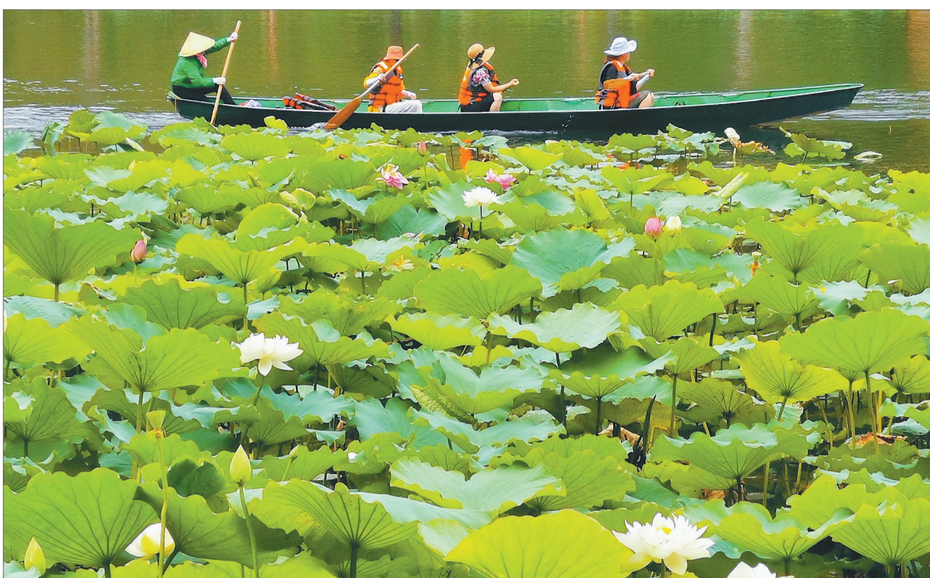
2019年7月，云南省文山州普者黑景区，游客在湖中游船。

古人还有在三伏日洗象的习俗。明人刘侗、于奕正撰写的《帝京景物略》记载：“伏日，官以旗鼓迎象入顺承门，浴响闸。象次第入于河也，则苍山之额也，额耳昂而翘，矫有蛟龙之势。象双挽索，首昂，时时出没其鬣。观者两岸万众，昂首如鳞次，编鬣焉。然浴之不能须臾，象奴辄调御令起，云浴久则相雌雄，相雌雄则狂。”