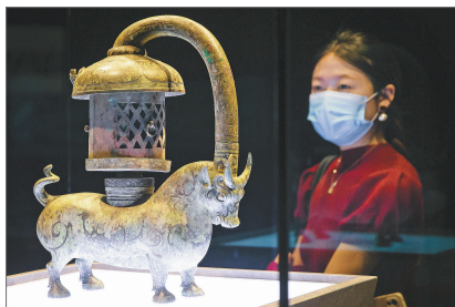
6月，南京博物院，游客参观汉代错金银牛灯。

在张勃看来，小暑时节的习俗活动反映了中国人顺天应时的文化精神。唐代诗人白居易有《消暑》诗云：何以销烦暑，端居一院中。眼前无长物，窗下有清风。热散由心静，凉生为室空。此时身自得，难教与人同。提醒人们在酷暑季节保持心境的宁静，对于现代人颇具启发意义。