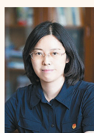
团邯郸市委全面落实党建带团建、队建，聚焦政治启蒙和价值观塑造，切实加强对少年儿童思想引领。建成全国首个综合性少先队主题场馆

升工程 进一步搭建好青年的成长、展示和关爱服务平台 持续提升青年创新创效水平 不断擦亮青年志愿服务品牌 着力打造一支以服务“双碳”为目标，以助力乡村振兴和共同富裕为方向，勇于担当、善于作为的新时代电力青年铁军，以奋发之姿笃行向未来。