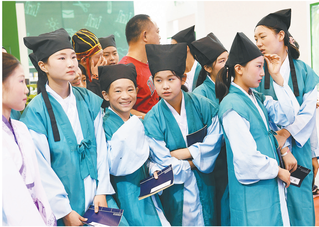
2018年7月14日，好文大家读活动亮相第八届江苏书展，苏州五所中学的师生们身着华服，手执羽扇，挥毫泼墨，字正腔圆地朗诵经典名篇，仿佛穿越时光，带领现场读者一同感受中华经典文化的内涵和精髓。

编者：我们希望中学生朋友把这里当作自己青春倾诉的阵地：你们可以把烦恼倒入树洞，你们可以把小心思贴上表白墙，你们可以秀一下流行在中学里的同好，你们可以把对教育对学校的问题抛给师说。来一起讨论与青春和成长有关的所有话题吧。这里没有高高在上的说教、没有板起面孔的批评，有的是大朋友与小朋友的坦诚交流。你们很快就会长大，你们将把青春留在这里，而我们始终与青春同行。 zhongxueshengzqb@126.com，我们在这里等你们。