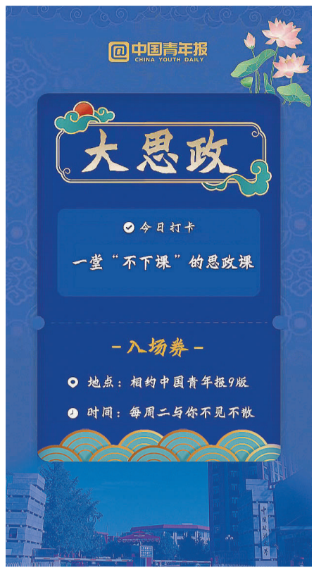
中青报 中青网记者 谢宛霏 实习生 刘一诺

政法大学坚持 法学教育必须重视实践教学,实践教学必须融入思政元素,各种法律实践的社