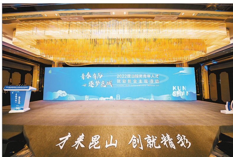
昆山服务青年人才就业创业主题活动