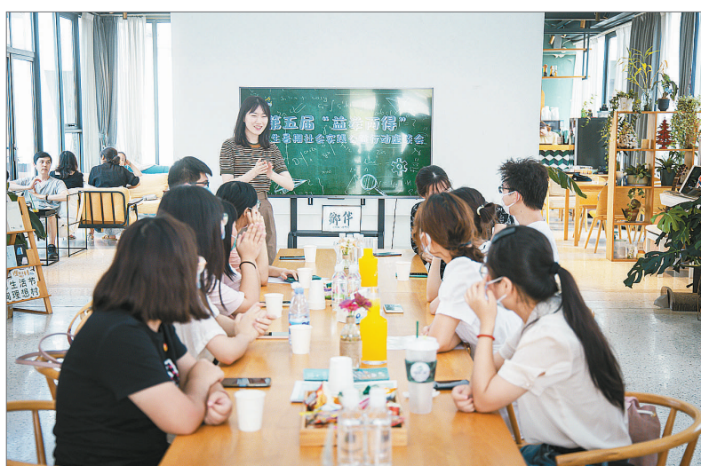
大学生暑期社会实践