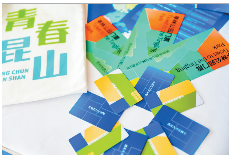
发行 青春惠联卡优惠卡和 青年人才交通卡