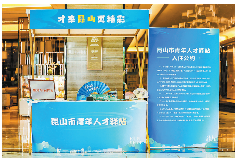
昆山市青年人才驿站