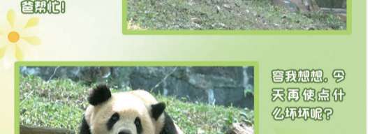
替我想想，今天再使点什么坏坏呢？