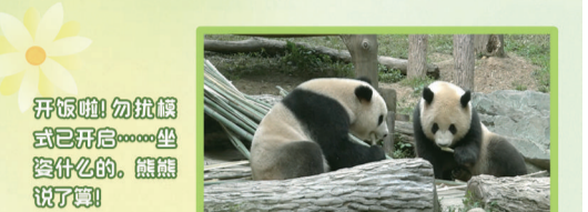
开饭啦！勿慌模式已开启……坐坐什么的，熊猫说了算！