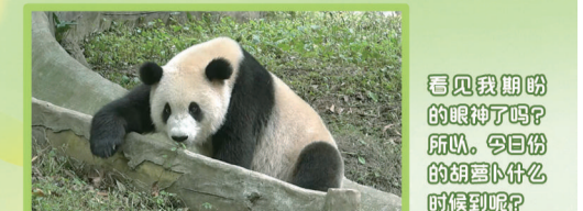
看见我眯眼的眼睛了吗？所以，它已经偷偷的偷看什么的时候呢？