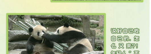
说好吃自己吃的。怎么又饿了？不讲道理！