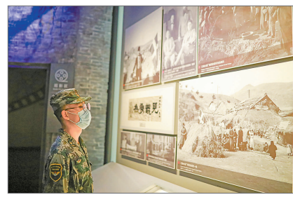
学生参观侵华日军南京大屠杀遇难同胞纪念馆。