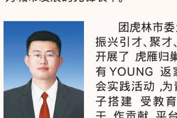
团黑龙江省林市委书记 王超

团迁安市委始终坚持以服务大局的工作主线，以中长期青年发展规划试点城市创建为抓手，实施青春领航、青春护航、青春助力、青春守护、青春建功、青春奉献五大工程，聚焦青年教育、青年创业、青年婚恋等十大领域，出台惠青政策20余项，打通堵点、优化营商环境、释放活力。充分发挥青年志愿者协会作用，引领青年志愿者踊跃投身疫情防控、乡村振兴、社会治理等重点工作。下一步，团迁安市委将进一步拓展试点创建效能，围绕服务大局及青年需求，立体整合行业青年、社会组织、青年志愿者等优势资源，引导更多青年成为城市发展的先锋表率。