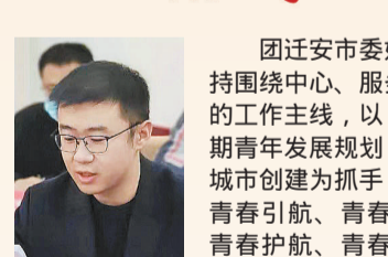
河北省迁安市委书记 旭海洋

团迁安市委始终坚持以服务大局的工作主线，以中长期青年发展规划试点城市创建为抓手，实施青春领航、青春护航、青春助力、青春守护、青春建功、青春奉献五大工程，聚焦青年教育、青年创业、青年婚恋等十大领域，出台惠青政策20余项，打通堵点、优化营商环境、释放活力。充分发挥青年志愿者协会作用，引领青年志愿者踊跃投身疫情防控、乡村振兴、社会治理等重点工作。下一步，团迁安市委将进一步拓展试点创建效能，围绕服务大局及青年需求，立体整合行业青年、社会组织、青年志愿者等优势资源，引导更多青年成为城市发展的先锋表率。