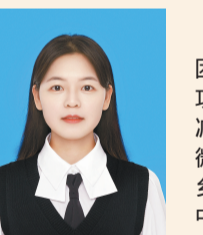
团黑龙江省密山市委书记 姚琦

贺街镇团委发挥自身组织优势,加强各类人才培养,通过开展疫情防控、反诈宣传、禁毒教育、返乡实践等活动,提高实践能力,培养青年榜样;依托青年议事会、青少年之家,开展活动20余次,为青年提供服务,助推广大团员青年成长成才。下一步,我们将继续利用龙业纪念馆、贺州文庙等红色资源,加大活动力度,带领团员青年,主动投入政务实践、公益活动、社区服务中,为服务青年和乡村振兴贡献青春力量。