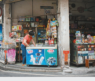
县城的人们总能找到自己喜欢的方式去热爱生活,把生活嚼得有滋有味。

不禁心生感慨,十几年过去,变迁在所难免,但还是唏嘘。这次回家过暑假,虽略有不适,但很快买东西的第一选择变成了更远、更大的超市。慢慢也发现,生活时时在运动,不存在一成不变的事物。 幼时坐在父亲的单车后座上,回望昏黄的路灯,总感觉这个县城是那么庞大,有着探索不完的边际,长大后,才发现仅仅用双脚便可丈量这片土地的大小。以前拥挤的街道,交错的电线,时不时传来的犬吠,编织成了记忆中模糊又清晰的存在。即使发展趋势不可阻挡,建筑拆了又建,人走了又来,很多回忆中的事物早已消逝。但这里依旧有亲人在,有从小玩到大的好友在,一起创造回忆的人还在,有他们陪伴,有他们在时光里等我,每每想到此便觉心安了下来。正如陀思妥耶夫斯基所说,要爱具体的人,不要爱抽象的人;要爱生活本身,胜于爱生活的意义。亲人、好友,成为我与县城无法分割的连结。有他们在的地方才是我的故乡。