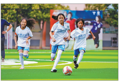
云南石林县长湖镇维则青联希望小学女足队队员在球场上训练。