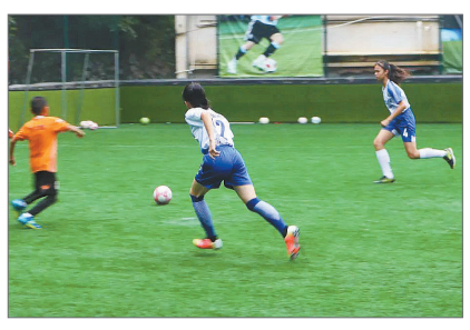
江西寻乌县澄江中心校女足队训练中。

2015年,赖文亮用矿泉水瓶充当标志桶,摆在泥土地上,训练学生的敏捷度。而今天,澄江中心校已经是 全国校园足球特色学校,球队成员的照片和近期的比赛被印刷在海报上,张贴在校园各处,开放式体育器材室里运动设备齐全。2019年,晨曦女足成为全国首批入选 追风计划 的10支球队之一,资金和资源支持纷至沓来。其后的3年中,晨曦女足连夺7个寻乌县校园足球联赛亚军,队伍也从最初的十几人,扩