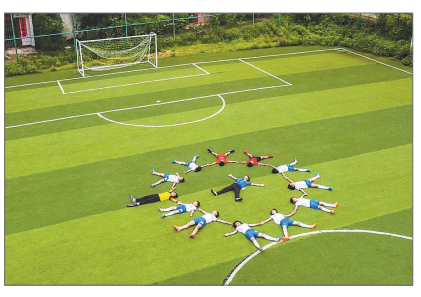
广东省梅州市兴宁市兴城灌新小学足球队队员在球场上。

不过,师资缺乏的困境正在被社会力量量的藤蔓顶出裂缝。靖外明德小学的6年级学生宁晶曾随队到昆明参加 追风计划 乡村校园女子足球联赛西南片区赛,从没见过 老外 的她还上了一堂外教课。外教夸张的肢体语言和授课口吻吸引力十足,以前我踢球的时候不太敢拿球,但那次听了老外教教练的课之后,我就比较愿意拿球了。外教讲的一个小笑话烙在宁晶脑中。