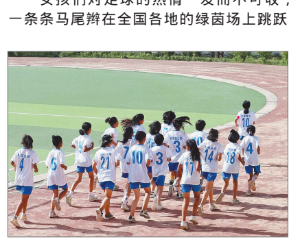
新疆喀什地区巴楚县第三小学女足队在操场上跑步训练。

在一座堪称 足球荒漠 的乡村,组建一支女足的第一步,是 碰壁。天天踢球,影响学习怎么办?