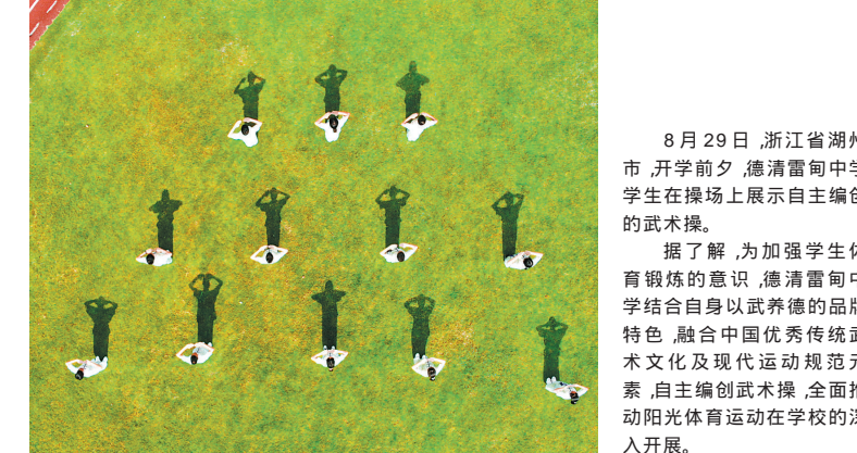
8月29日,浙江省湖州市,开学前夕,德清雷甸中学学生在操场上展示自主编创的武术操。

中华民族是勤于劳动,善于创造的民族,正因为劳动创造,我们才拥有了历史的辉煌,也正因为劳动创造,我们才拥有了今天的成就。我们也应当像我的爷爷锻刀那样辛勤奋斗,以劳动铸辉煌。