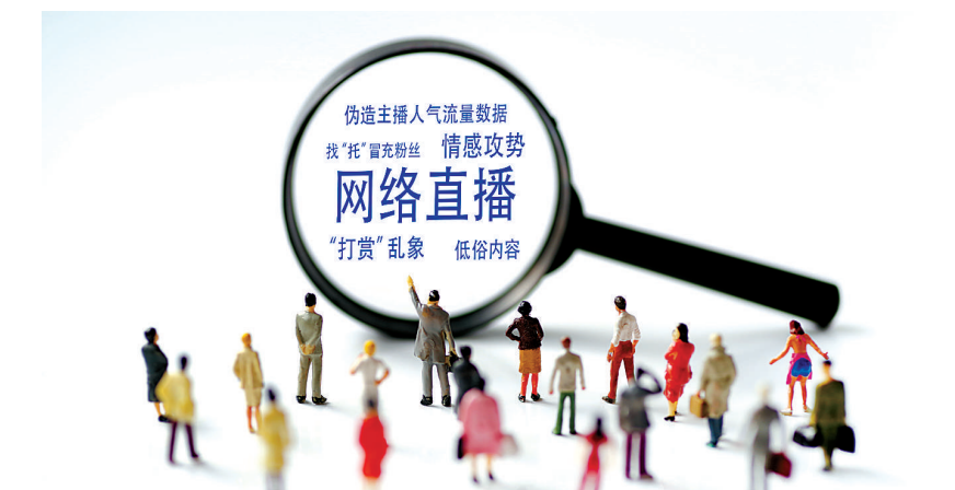
漫画:网络直播打赏乱象。

网络直播能消磨无事可做的碎片空闲时间。快节奏的城市生活中,人们大多因为学业、工作、生活等各种各样的原因奔波劳累,导致难以接受耗费较长时间才能做出成果或需要大量思考的放松方式(前者比如拼图、绘画,后者比