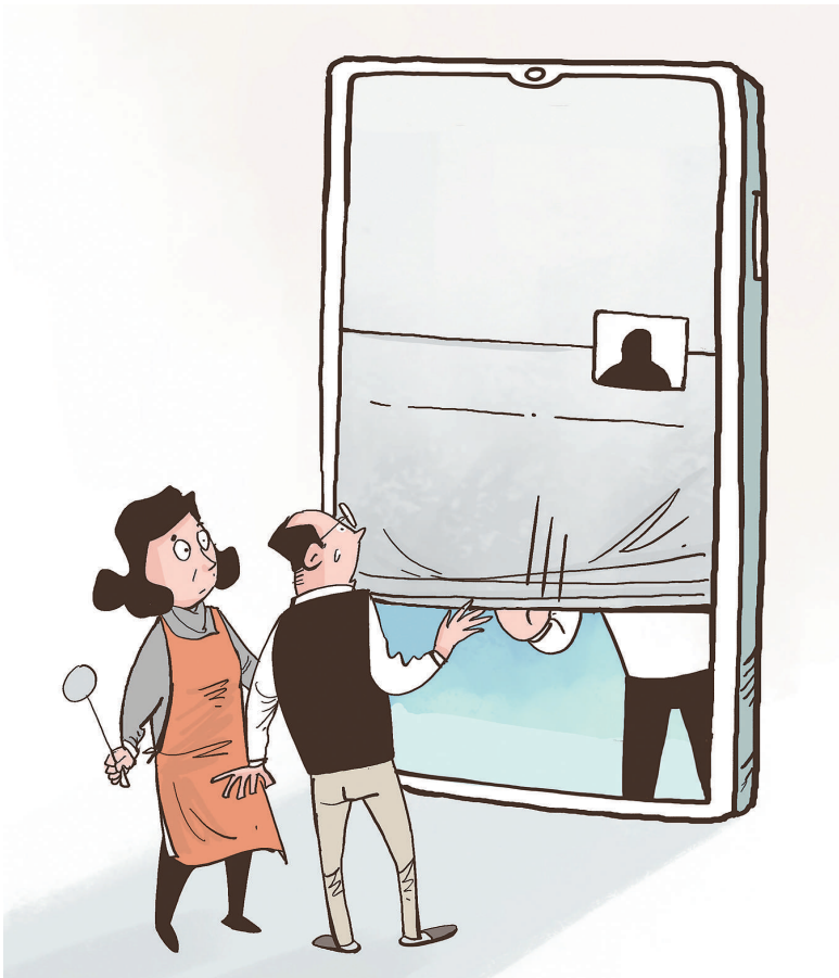
漫画:朋友圈屏蔽父母。