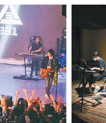
广州南方学院 学生乐队正排练曲目