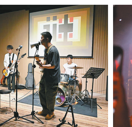
广州新华学院 刘翔宇/摄 说唱歌手现场演绎动感旋律