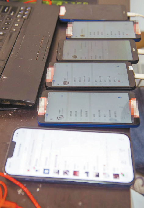
现场正在实施诈骗的手机。

当他卡里出现6.5万元的提现资金后，他彻底相信了，在随后三天内，陆陆续续投入了1340万元。他看着账户里，虚拟货币的获利慢慢