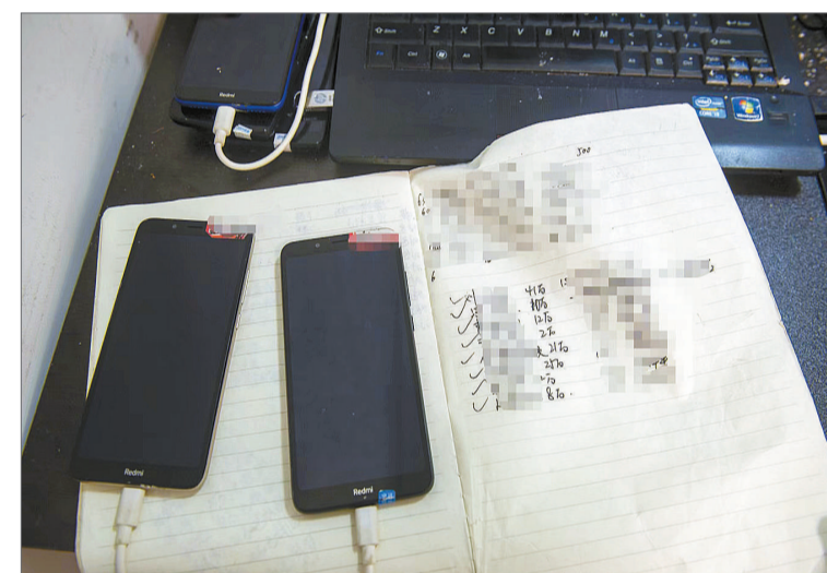
在犯罪窝点找到的工作记录本。

慢涨到了几亿，这来钱太快了，比他干工程快得多。后来，他和民警说，那会儿自己甚至开始考虑退休，再也不用奋斗了。