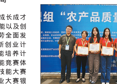
苏州牌联全国职业院校技能大赛农产品质量安全检测一等奖