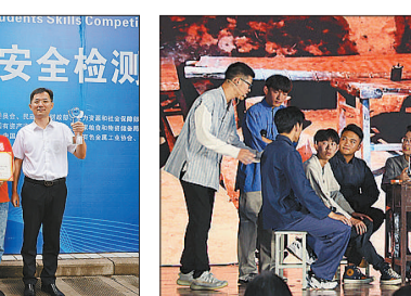
农耕文化短剧表演