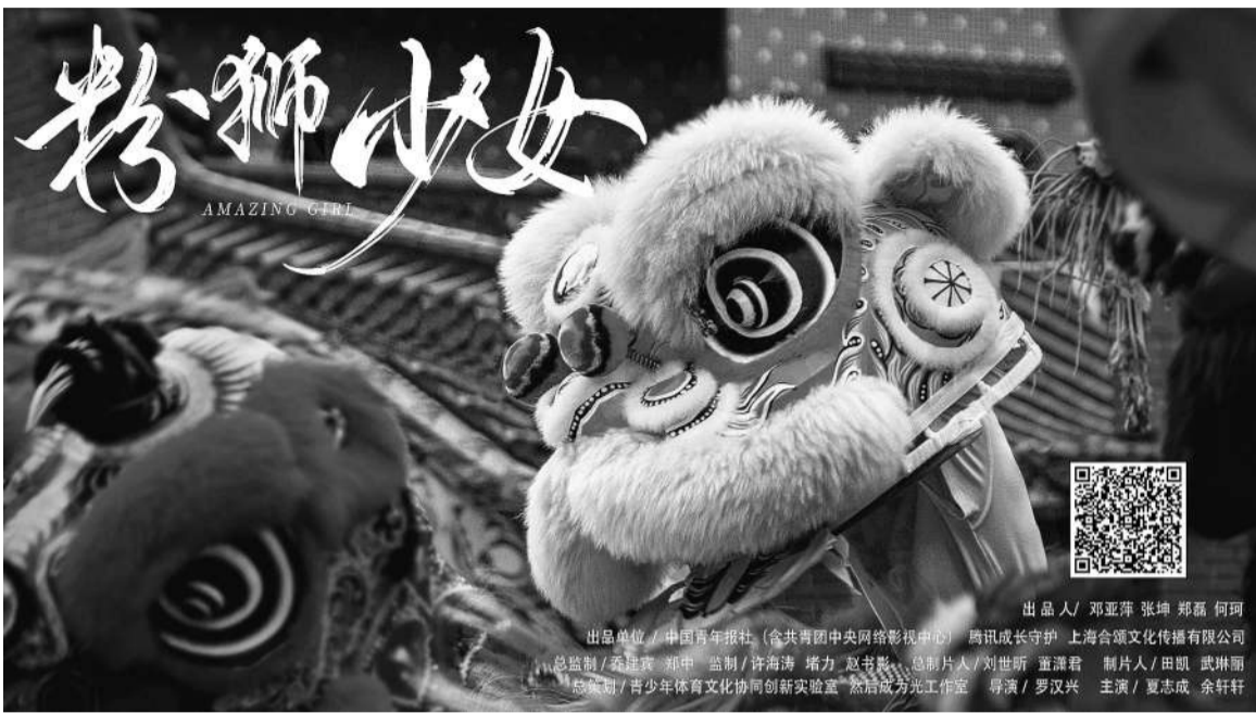
出品单位：中国青年报社（含共青团中央网络影视中心） 腾讯成长守护 上海合颂文化传播有限公司 出品人：邓亚萍 张娜 郑磊 何珂 总策划/总导演：郑中 监制：许海博 杨力 赵书华 总制片人：刘世昕 董淑君 制片人：田颀 武珊珊 出品/发行：青少年体育文化协同创新中心 联合发行：光工作室 导演：罗汉兴 主演：罗志成 余轩轩