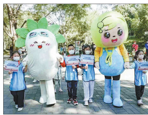
文明游园 吉祥物与志愿者小朋友手拉手进行宣传。

这些文创资源都将是北京公园开展文明游园活动的素材。今天推出的 文小明 和 游小园 是北京文明游园的卡通形象代言,未来,在全市各大公园它们会与市民游客有更亲密的接触。我们希望通过这两个形象和游客的互动,让