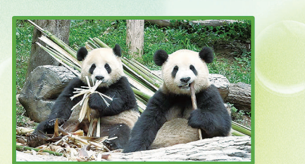
喜迎国庆节,给大家喊声“花花”!