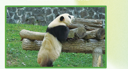
最美丽的,永远是努力的背影。