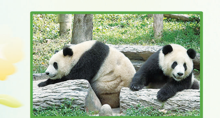
惬意的午后,是为了更好地出发。