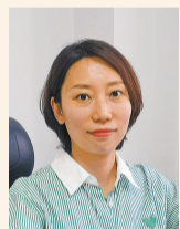
团河北省保定市委

团莲池区委以河北省青年发展型县域试点为契机,围绕《保定市莲池区创建青年发展型城区试点实施方案》提出的乐居、乐业、乐享、乐为四大友好环境,邀请河北大学专家团队编制《保定市莲池区青年发展规划(2022-2025)》,完善青年工作联席会议制度,健全39个区直部门合力推进的常态化创建机制,多元化定制青年服务项目,打造两家高标准青年驿站,为来莲求职应聘青年提供短期优惠入住条件,开展返乡扬帆计划、青苗计划等大学生社会实践活动,协调推动青年友好街区、青春友好社区建设,设置青年文化周、青年文化节,举办青年文艺汇演、青年沙龙,激发青年活力。接下来,团莲池区委将进一步发挥桥梁纽带作用,把青年的痛点、难点作为工作的发力点,在青年就业创业、婚恋交友、社会融入、子女教育等方面强化工作举措,为推动青年发展型城区建设贡献青春力量。