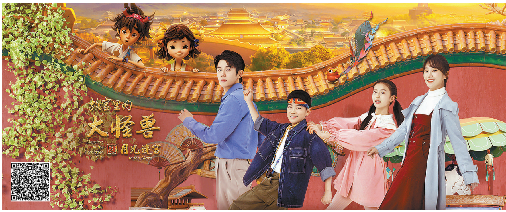
本文配图均为《故宫里的大怪兽》剧照。