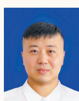
团黑龙江省鹤岗市绥滨县委书记

团莲池区委以河北省青年发展型县域试点为契机,围绕《保定市莲池区创建青年发展型城区试点实施方案》提出的乐居、乐业、乐享、乐为四大友好环境,邀请河北大学专家团队编制《保定市莲池区青年发展规划(2022-2025)》,完善青年工作联席会议制度,健全39个区直部门合力推进的常态化创建机制,多元化定制青年服务项目,打造两家高标准青年驿站,为来莲求职应聘青年提供短期优惠入住条件,开展返乡扬帆计划、青苗计划等大学生社会实践活动,协调推动青年友好街区、青春友好社区建设,设置青年文化周、青年文化节,举办青年文艺汇演、青年沙龙,激发青年活力。接下来,团莲池区委将进一步发挥桥梁纽带作用,把青年的痛点、难点作为工作的发力点,在青年就业创业、婚恋交友、社会融入、子女教育等方面强化工作举措,为推动青年发展型城区建设贡献青春力量。