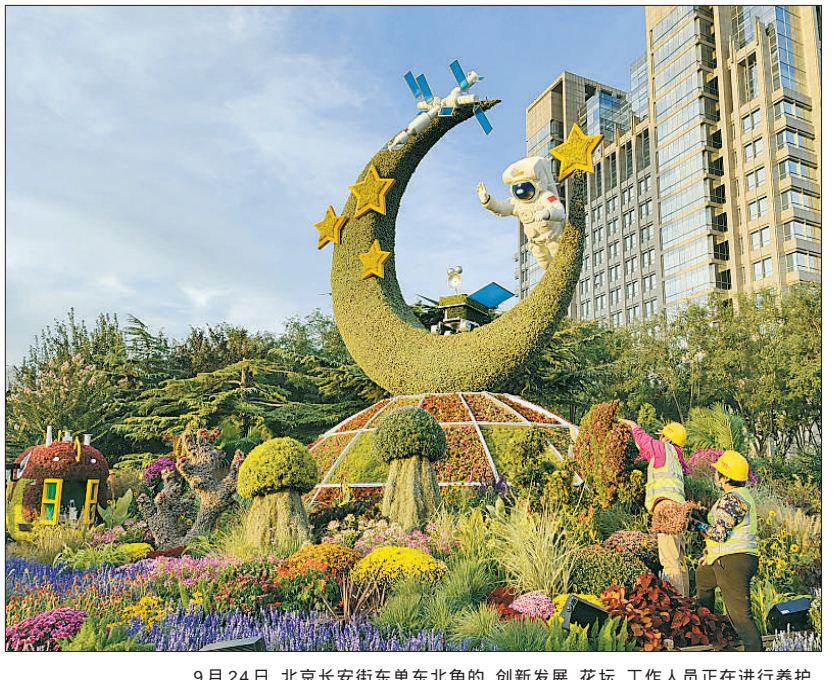
9月24日，北京长安街东单东北角的创新发展花坛，工作人员正在进行养护。

花坛方案确定后，技术团队会根据各个花坛的主题及图案进行花卉的配置。例如，协调发展花坛表现的是京津冀协调发展，团队有针对性地选择了华北地区的乡土植物，如华北香薷、大叶铁线莲、全叶马兰等。为了模拟白洋淀芦苇荡景观，团队选择矮蒲苇、观赏草等植物进行还原。创新发展花坛则选取众多国内自主选育新品种，如花木小菊、绚秋系列、狼尾草、丽