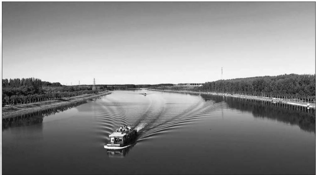
京杭大运河全线贯通后,北京市通州区运河游船开通观光航线。