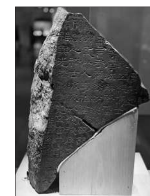
《熹平石经》，中国国家博物馆馆藏。