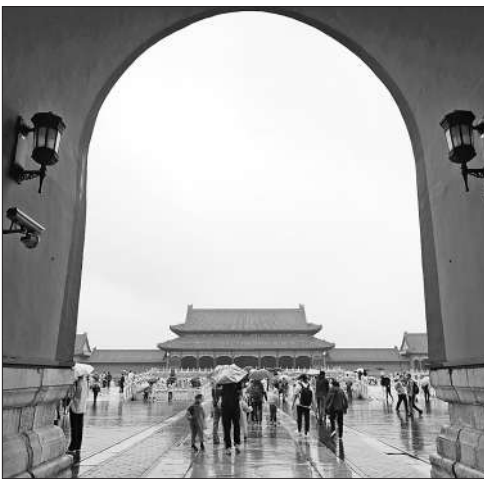
10月2日，北京故宫博物院院内，游客在雨中游览。

吴良镛倡导的融贯的综合研究方法，更让单霁翔认识到，故宫博物院的事业是全民共同的事业，封闭的故宫应该打开，应该成为老百姓日常生活中的一片文化绿洲。