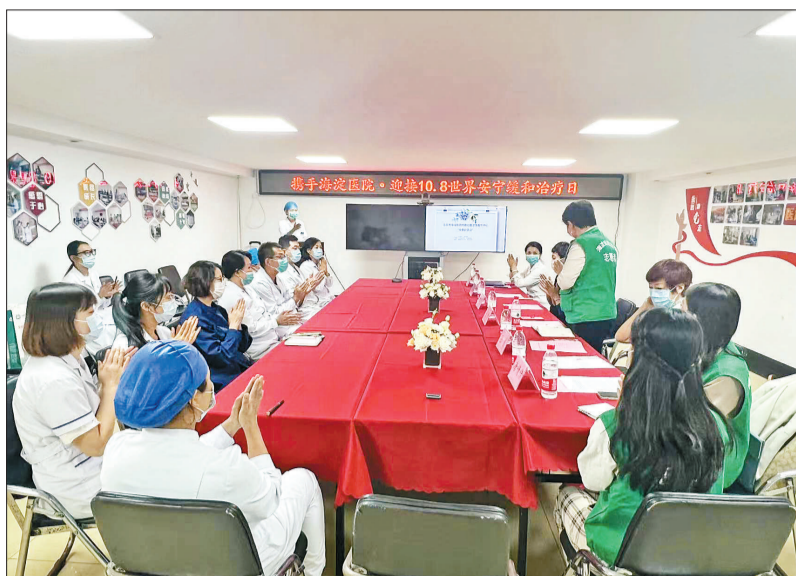
和平里社区卫生服务中心，工作人员向居民普及安宁缓和医疗理念。

然而，不可忽略的现实是，安宁缓和医疗理念在医生群体中的普及率也远远不够，这源于医学教育中这一环节的缺失。目前国内医学院中，只有少数学校开设了缓和医疗相关课程。在大多数