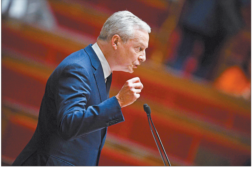
当地时间10月10日，巴黎，法国经济和财政部长勒梅尔在国民议会发言时，批评美国经济强权，呼吁欧美之间建立更加平衡的经济关系。

今年2月俄乌爆发军事冲突，美国趁机怂恿其欧洲盟友制裁俄罗斯，鼓动欧盟禁止使用俄罗斯石油和天然气，降