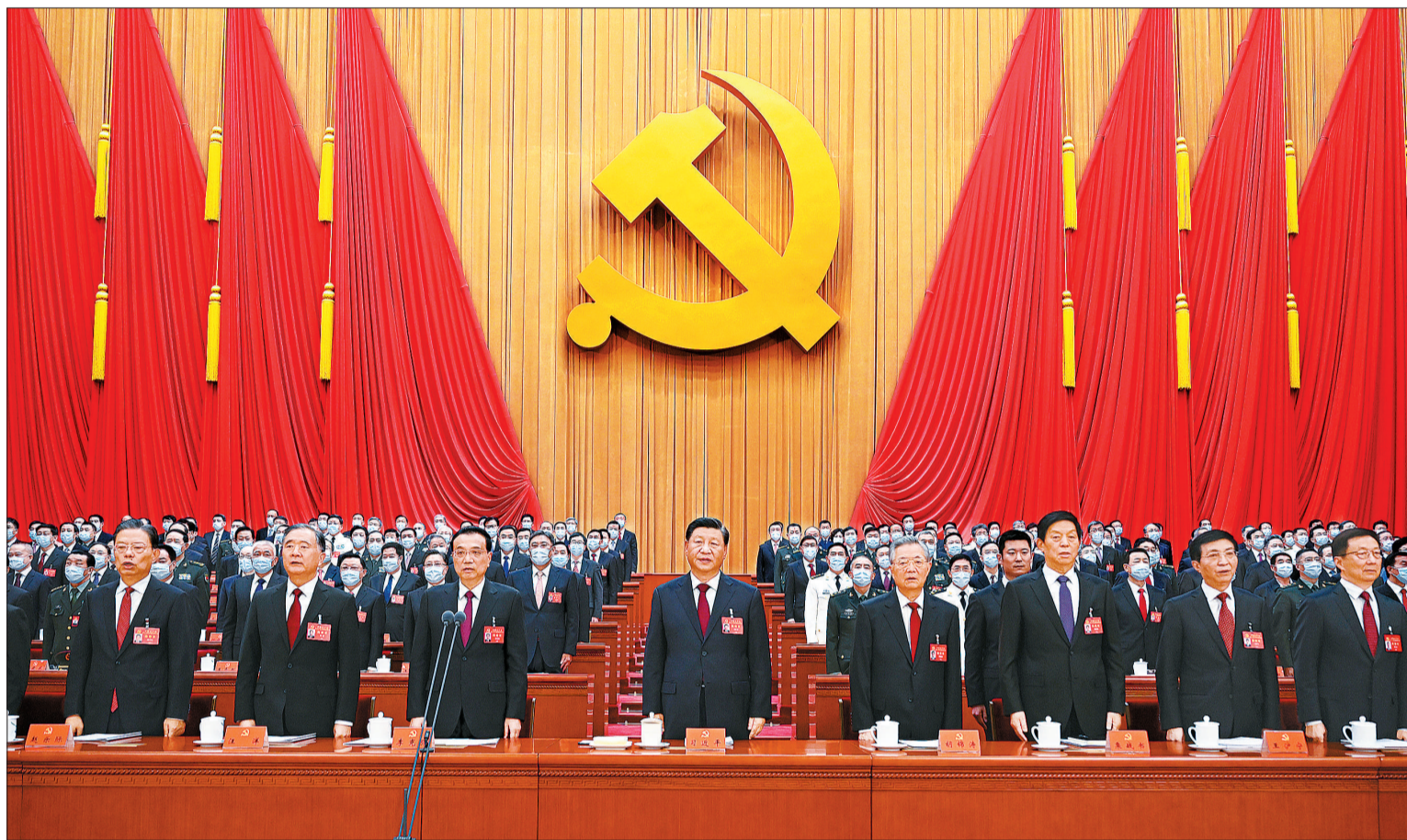
10月16日，中国共产党第二十次全国代表大会在北京人民大会堂开幕。这是习近平、李克强、栗战书、汪洋、王沪宁、赵乐际、韩正、胡锦涛在主席台上。

新华社北京10月16日电 凝心聚力擘画复兴新蓝图，团结奋斗创造历史新伟业。举世瞩目的中国共产党第二十次全国代表大会16日上午在人民大会堂开幕。