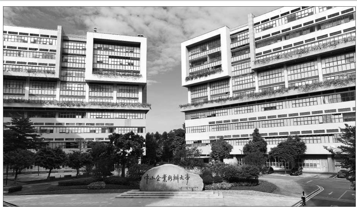
广州开发区科技企业加速器园区