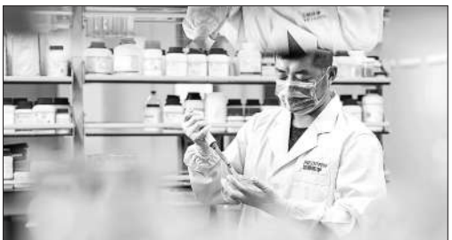
迈普医学研发人员正在进行研发实验