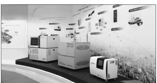
禾信仪器的质谱仪产品