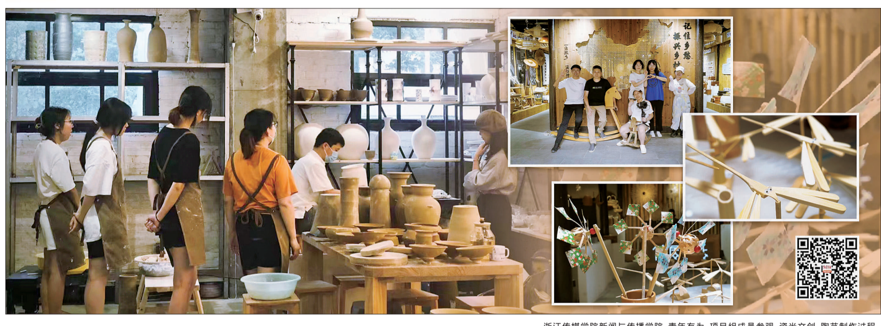
浙江传媒学院新闻与传播学院 青年有为 项目组成员参观 瓷米文创 陶艺制作过程。