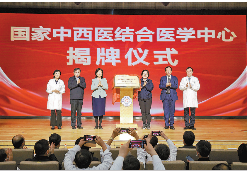
10月25日,国家中西医结合医学中心揭牌仪式在北京中日友好医院举行。

中西医协作模式将如何聚焦慢病管理?周军院长告诉记者,以肿瘤为例,中日友好医院中西医结合肿瘤内科学经过