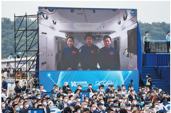
11月8日,广东省珠海市,第十四届中国国际航空航天博览会开幕式上,正在太空执行任务的神舟十四号航天员陈冬、刘洋、蔡旭哲在中国空间站发来了太空祝福。