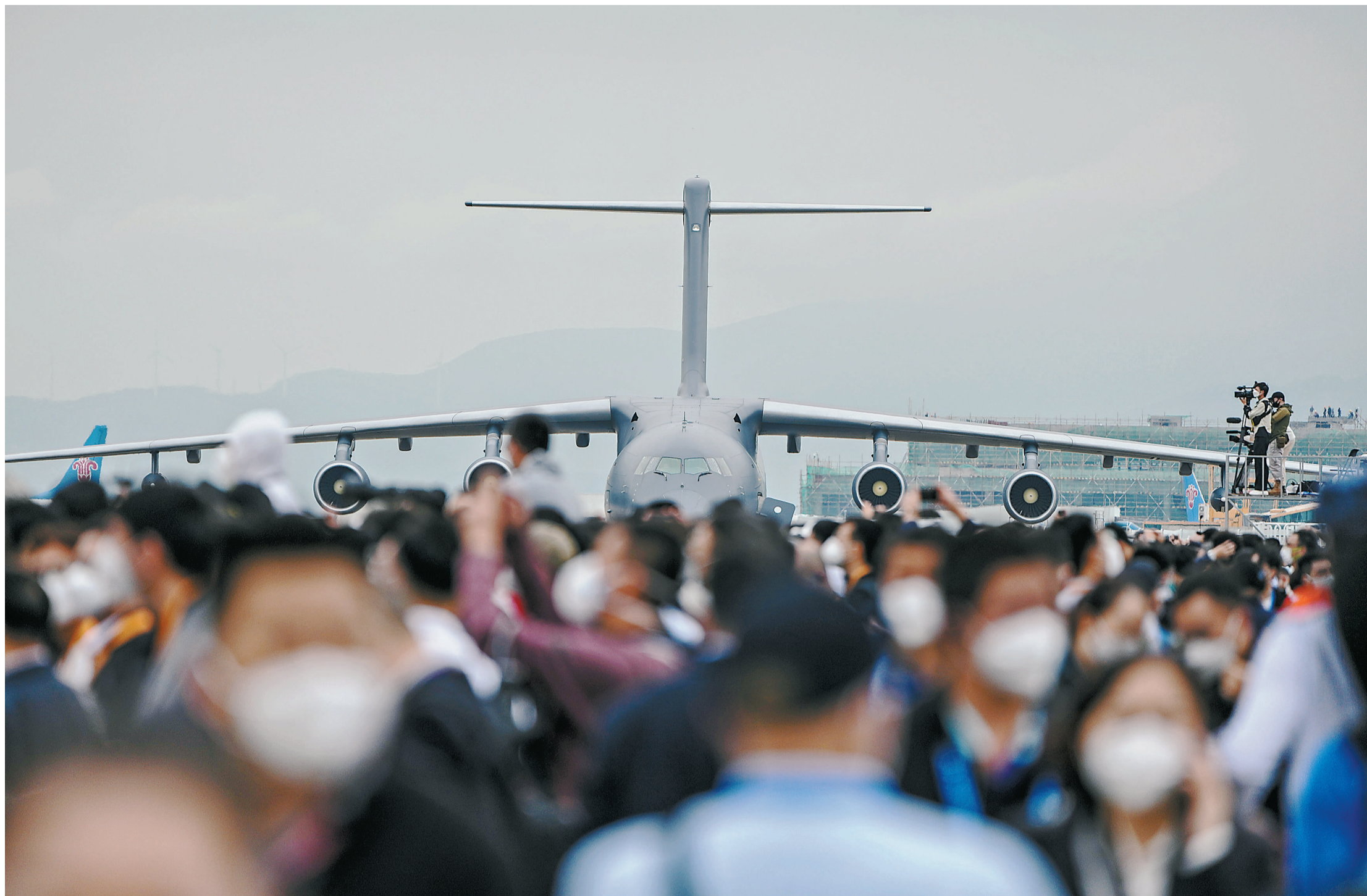
11月8日 广东省珠海市,第十四届中国国际航空航天博览会上,我国新一代空中加油机运油-20亮相相航展现场。当日,首次亮相中国航展的运油-20,展示了大坡度机动、拖曳通场等多个动作。据了解,本次航展有来自43个国家和地区的740多家海内外企业线上线下参展,一批代表世界先进水平的高、精、尖展品首发首秀。