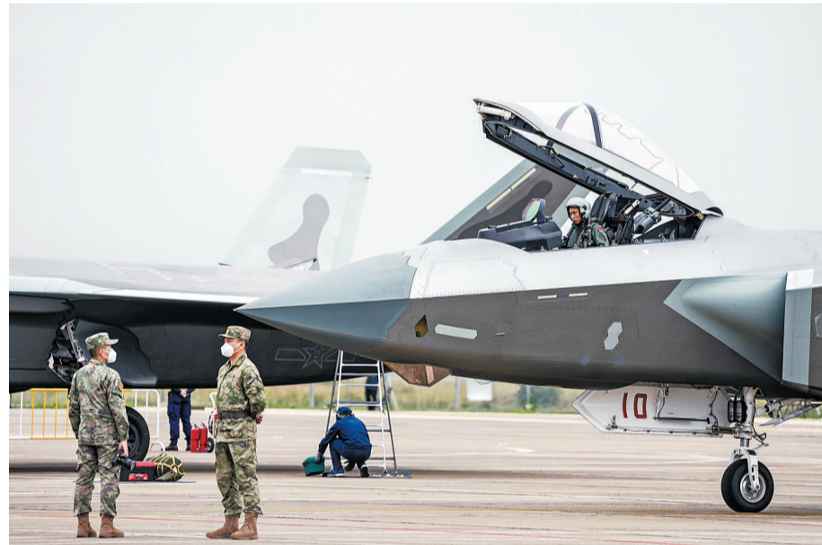
11月8日,广东省珠海市,第十四届中国国际航空航天博览会上,停放在跑道上的歼-20飞机。

11月9日早晨,天空格外晴朗,航展上人潮涌动,众多的大国重器、精彩的飞行表演让人们流连忘返。自1996年举办首届以来,中国航展已成为集中展示中外航空航天先进技术和高端装备的重要窗口、促进航空航天技术和装备领域商贸合作的国际平台。