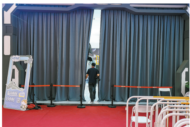
11月8日,广东省珠海市,第十四届中国国际航空航天博览会上,一名记者走进航空工业展区的沉浸式体验馆。

当4架歼-20战机低空通场亮相,进行了双机对冲、单机横滚、四机通场、前双机盘旋、后双机水平交叉等一系列精彩表演课目后,其中两架首次降落在珠海国际航展中心进行地面展示。跑道安全隔离栏外,观看飞行表演的人们欢呼声和相机快门声交织在一起,一名年轻人对身边的伙伴说,瞧,这就是自信。