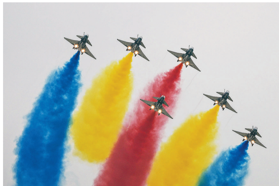
11月8日,广东省珠海市,第十四届中国国际航空航天博览会开幕式上,中国空军八一飞行表演队进行飞行表演。