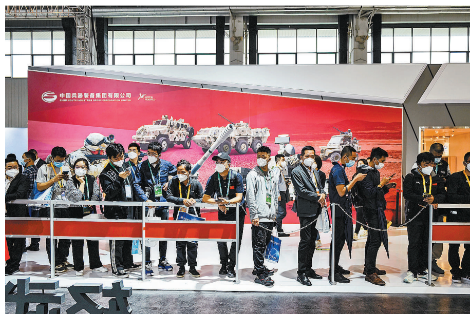
11月8日,广东省珠海市,第十四届中国国际航空航天博览会8号馆的轻武器展区,排队等待体验的观众。