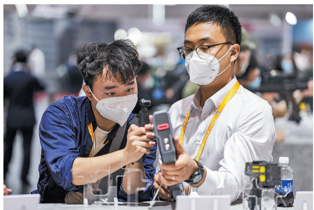
11月8日,广东省珠海市,第十四届中国国际航空航天博览会8号馆的轻武器展区,一名男士在体验手枪装备。