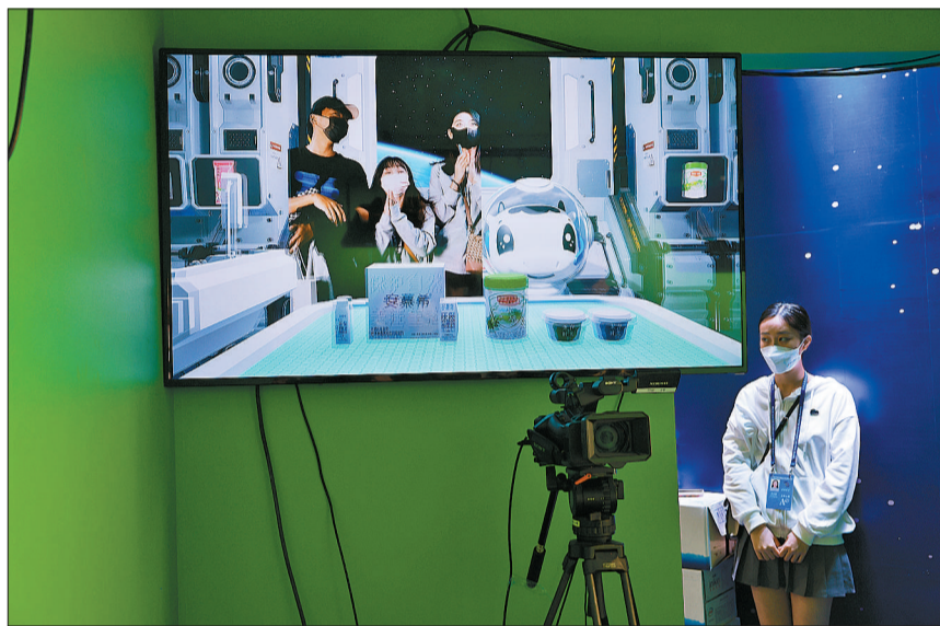
11月10日,浙江省桐乡市乌镇,在2022年世界互联网大会互联网之光博览会上,几名年轻人在体验元宇宙空间。他们跟随吉祥物在屏幕上沉浸式体验虚拟制作的“零碳”生产过程。

中国式的现代化是物质文明和精神文明相协调的现代化,在李航看来,现代化的中国,不仅是物质上的共同富裕,也要有文化上的共同富裕。而数字技术是助力文化共同富裕的重要手段,将传统文化创造性转化为数字内