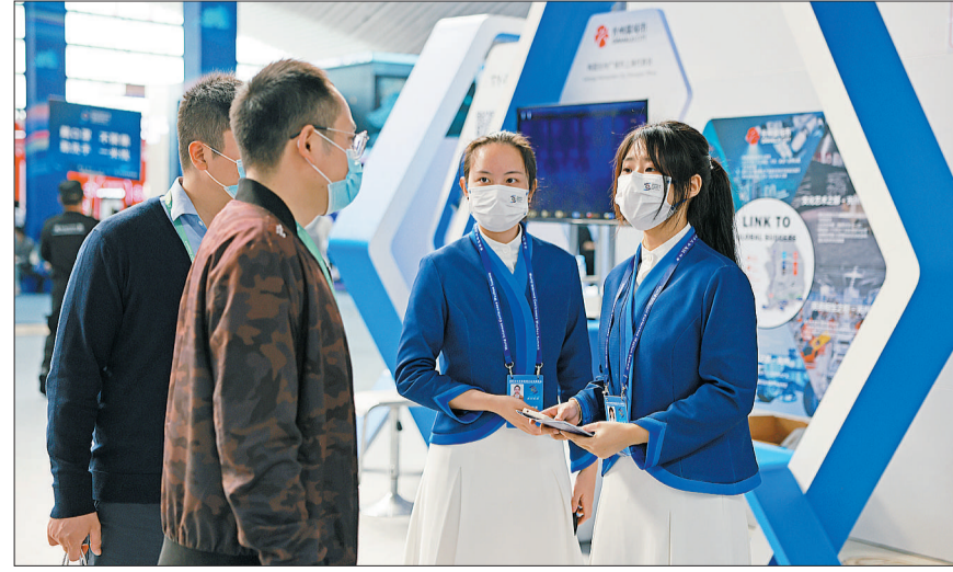
11月10日,浙江省桐乡市乌镇,在2022年世界互联网大会互联网之光博览会上,两名志愿者小梧桐在为参观者提供咨询,她们都是来自浙江湖州学院的大学生。服务今年互联网大会乌镇峰会的小梧桐共有726名,来自浙江省内18所高校,近95%为00后。