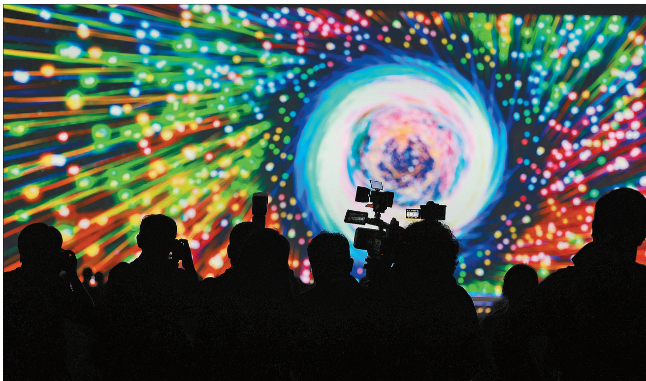
11月9日,浙江省桐乡市乌镇,2022年世界互联网领先科技成果发布活动现场。

数字经济场域里,一端链接着中小微企业的生存发展,一端链接着青年就业。作为互联网企业,90后、00后的