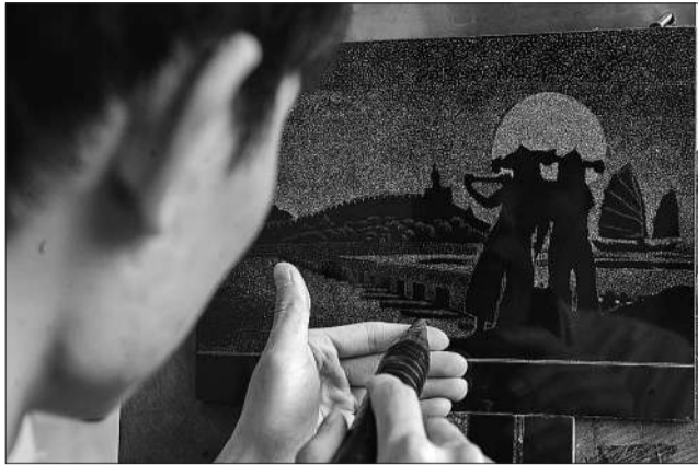
11月20日,听障学生在泉州市特殊教育学校听障职教大楼上影课。为了听障学生更好地融入社会,福建省泉州市特殊教育学校开设了美容美发课、茶艺课、奶茶制作课、影雕课、漆艺课等15项全日制职业培训课程,提升学生的职业技能,拓宽学生的就业渠道。学校还搭建了听障学生就业创业孵化平台,提升听障学生的就业率。

有的受访博主则表示,接到商家联系后,会对产品进行一段时间的试用,根据产品质量或效果再决定是否合作。