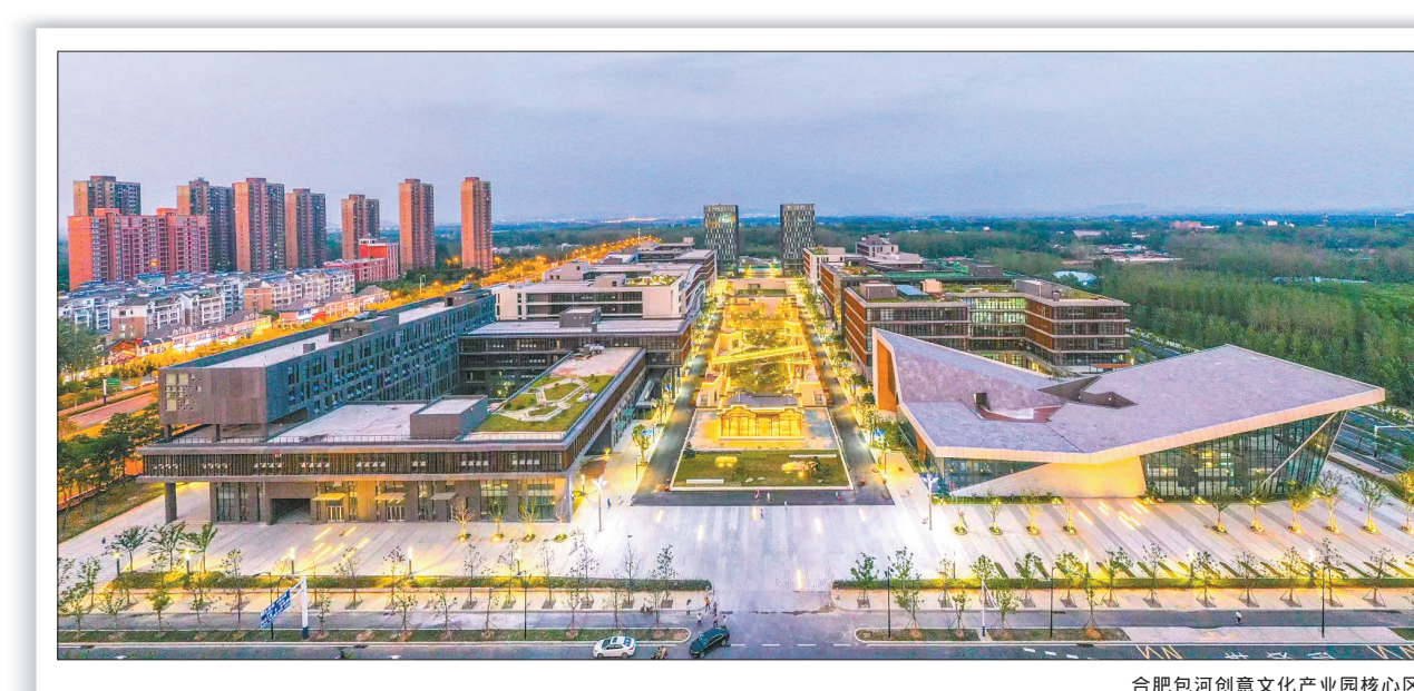
合肥包河创意文化产业园核心区

成立创意文化产业链党委,组建产业链专班,实施链长制,区委主要负责同志定期调度,建立三库,即企业库、项目库、数据库,构建五个一工作机制,