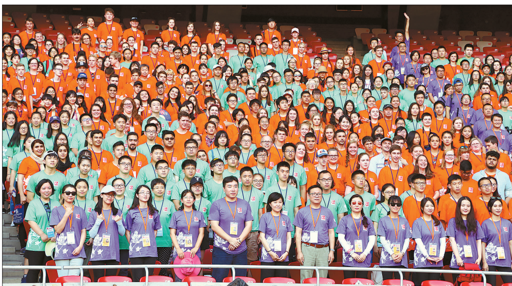
2017年7月15日,2017国际学生北京夏令营800余名中外师生走进北京国家体育场(鸟巢)参观,体验鸟巢文化之旅,感受北京奥运文化。

让学生参与跨文化的交流,以游学、辩论、角色扮演等形式让学生理解不同文化,形成对文化