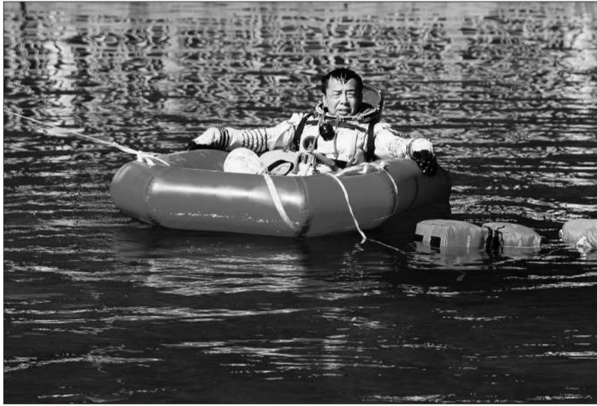
邓清明在进行水上出舱训练。

一个极具纪念意义的日子，上级宣布了李庆龙、吴杰、陈全、潘占春、赵传东这5名航天员停航停训的命令。