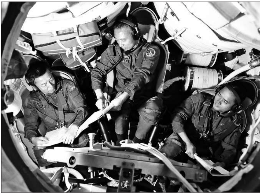
神舟十五号航天员乘组进行飞船模拟器训练。