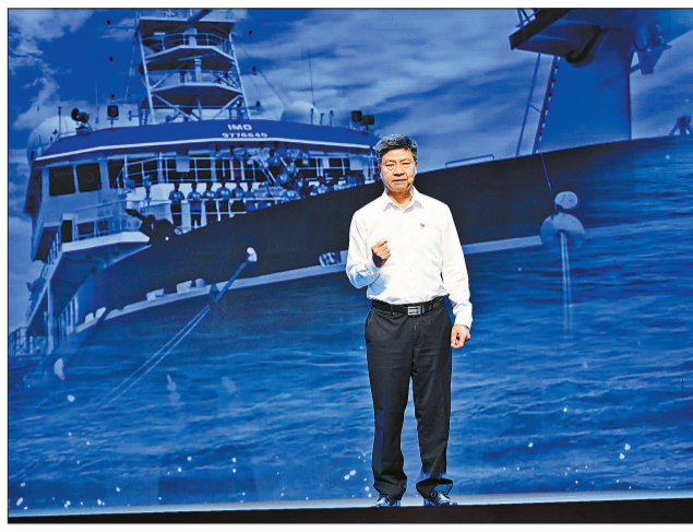
11月25日,党的二十大代表、中国科学院院士孙世刚讲述《那一艘向海图强的远洋船》。

100多年前,华侨陈嘉庚将厦门大学的碑石嵌入墙基之时,埋下了一个精致的石雕盒子,里面是一份筹办大学的演讲稿。 1921年,陈嘉庚梦想里那座要让外国的轮船从海上一眼就看到一所壮观的学府——厦门大学在东海旁成立。 1940年,陈嘉庚和毛泽东在延安相见,陈嘉庚离开时说了一句:中国的希望在延安。 那份希望历经100多年的风雨依然闪光,爱国情、报国志在一代代青年身上化为强国行动。11月25日,把青春华章写在祖国大地上大思政课网络主题宣传和互动引导活动在厦门大学的百年建南大礼堂举行。