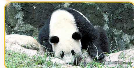
吃饱饱,喝好汤,巴适!