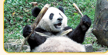
吃货在手,美味我有!