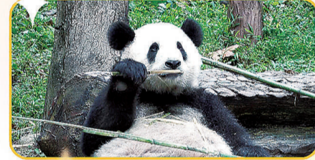
吃货变身“小富翁”,好用!