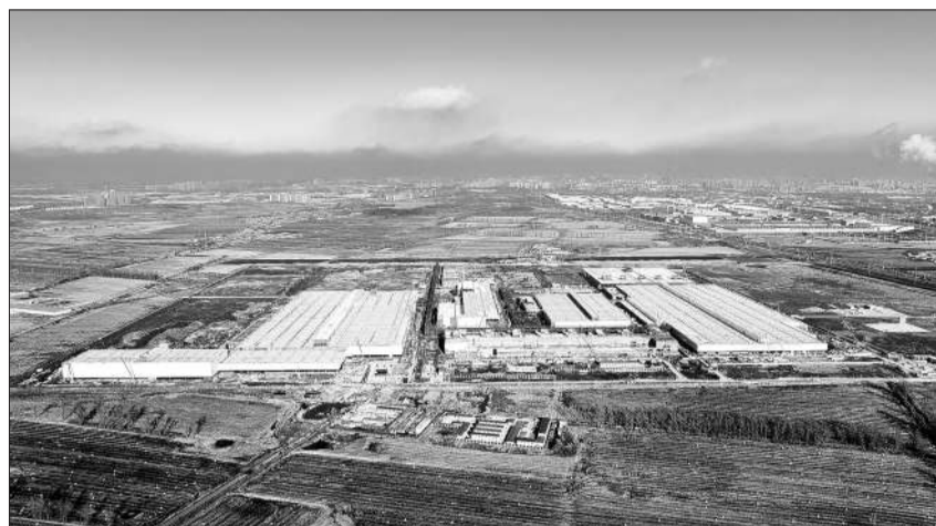
11月21日,奥迪一汽新能源汽车有限公司主建筑结构完全封顶,比原计划工期提前一个月,为冬季正常施工打下了坚实基础。这里将投产奥迪A6 e-tron、奥迪Q6 e-tron等PPE平台纯电动车型。

尽管开工时间因新冠肺炎疫情而被推迟,但奥迪一汽新能源汽车工厂仍提前一个月封顶。速度奇迹是多方共力的结果,施睿哲表示,团队高效工作协同和高标准数字解决方案的指引,以及吉林省政