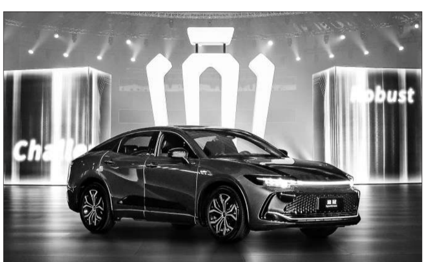
皇冠从一款轿车进化成为一个独立的豪华车品牌,已开启突破自我的全新布局。图为皇冠品牌首款中型豪华跨界车全新皇冠SportCross。

全新皇冠SportCross作为丰田先进技术的旗舰,搭载丰田2.4T涡轮增压发动机加6速自动变速箱的全新混合动力系统Dual Boost Hybrid System。