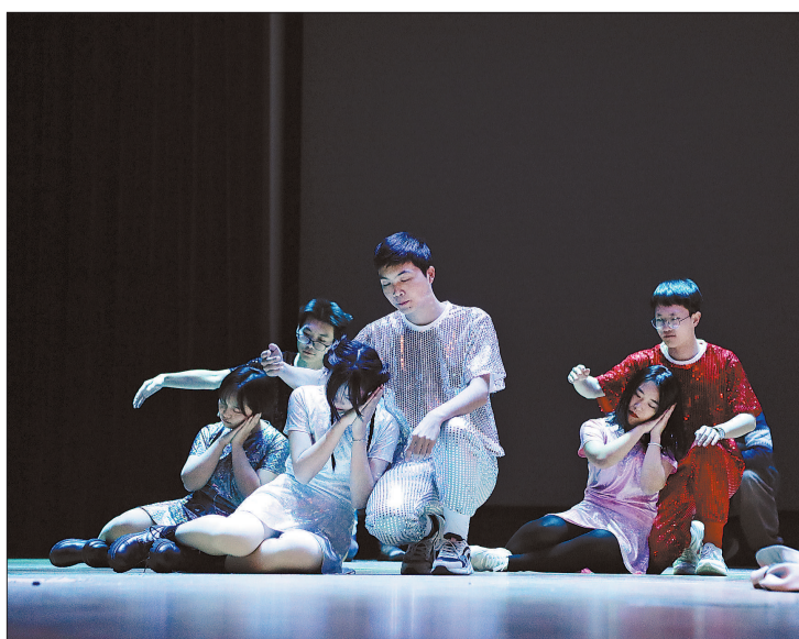
北航心理剧演出现场。

在心理学上，内心有冲突其实是一件非常好的事情。而懂得怎样超越冲突，就说明一个人成熟了。李卫华说。