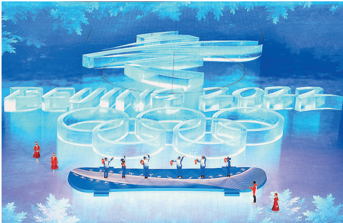
2022年2月20日，北京，2022北京冬奥会闭幕式，志愿者代表接受表彰与感谢。

2023年即将来临，每一位00后的生活都在继续，成长道路虽然曲折，但终有绽放的那一天。