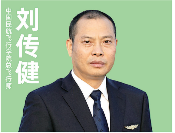
刘传健 中国民航飞行学院总飞行师