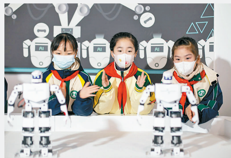
1月4日,江苏南通,海安市教师发展中心附属小学的学生在海安市科技馆观看智能机器人表演。