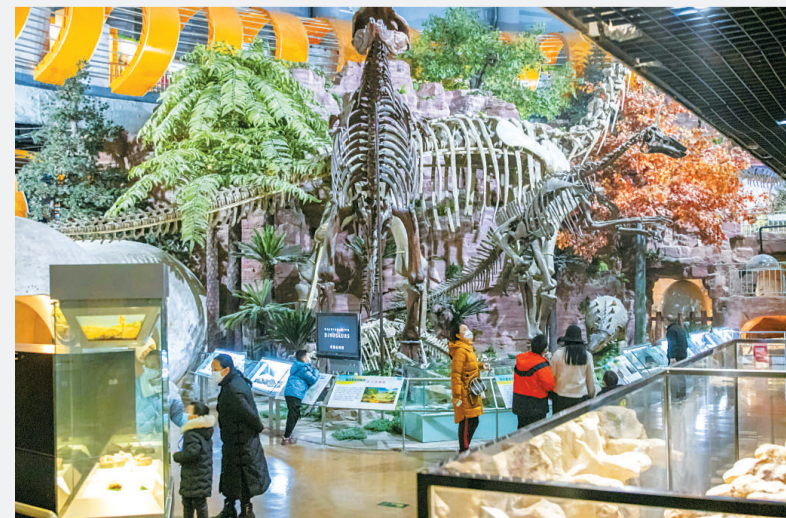
1月4日,郑州,正值寒假期间,不少家长带着学生来到河南自然博物馆参观、探秘,乐享寒假时光。