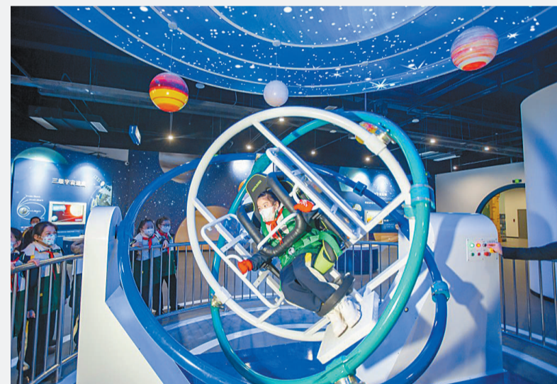
1月4日,江苏南通,海安市教师发展中心附属小学的学生在海安市科技馆体验科普装置。