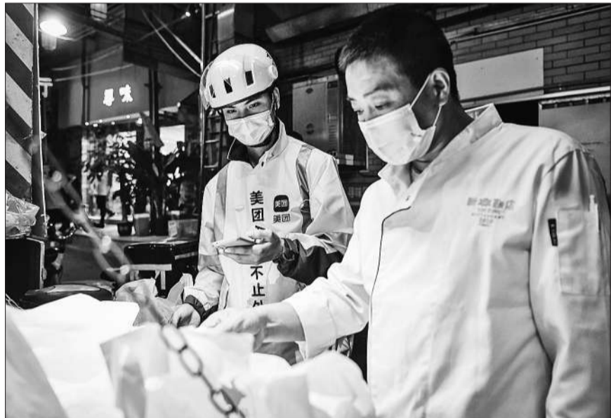
新春期间 外卖团年夜饭下单需求旺盛。